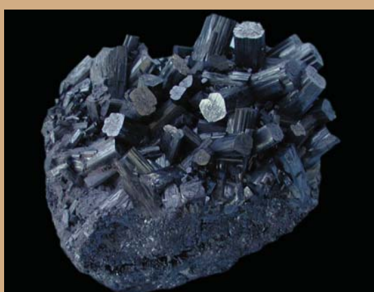
Μαγγανιούχο μέταλλευμα: MnO_2

Χρήσεις: για παραγωγή σιδηρομαγγανίου, σε μπαταρίες κ.ά. Εντοπισμός: Παλαιά Καβάλα, Δράμα, Εύβοια, Ερτεινή, Ανδρος, Πάρος, Βάνι Μήλου.