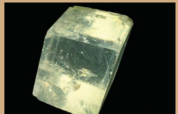
Ασβεστίτης: CaCO_3 (ασβεστόλιθος)

Χρήσεις: παραγωγή ασβέστη, κονιάματα, βελτιωτικό χόματος, επενδύσεις σε οικοδομές, τσιμέντο κ.ά. Εντοπισμός: σε πολλές θέσεις του Ελλαδικού χώρου.