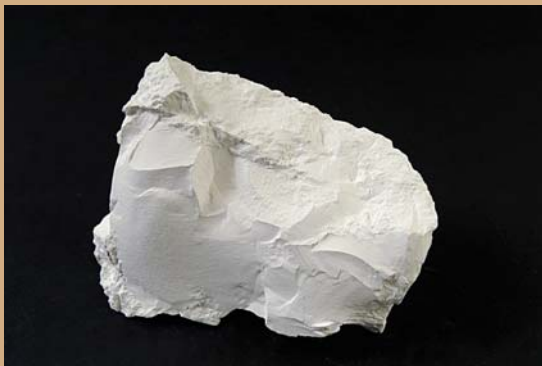
Μαγνησίτης (λευκόλιθος): MgCO_3

Χρήσεις: για παραγωγή πυριμάχων υλικών, στο χαρτί, στις ζωοτροφές. Εντοπισμός: Μαντούδι Ευβοίας, Γερακινή Χαλκιδικής, Μυτιλήνη.